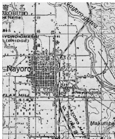
図2 北海道名寄市（1924年）